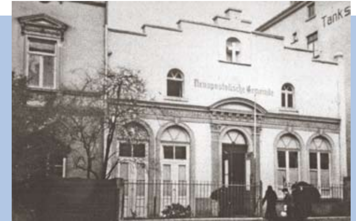
Außenansicht der Kirche, genaue Zeit der Aufnahme unbekannt