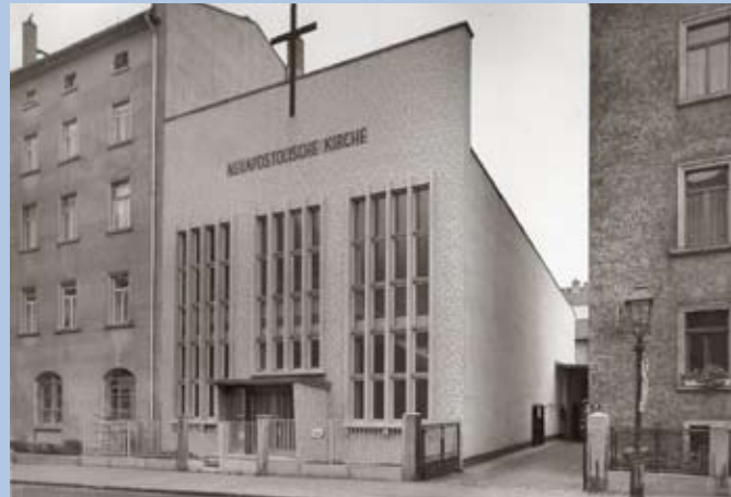
Außenansicht der Kirche, genaue Zeit der Aufnahme unbekannt

Die Liegenschaft mit der postalischen Anschrift Luisenstraße 3 liegt heute im Stadtteil Frankfurt-Nordend-Ost. Historisch betrachtet ist das Gebiet um den Merianplatz Teil dessen, was vom frühen 16. bis zum späten 19. Jahrhundert die Bornheimer Heide (in historischen Quellen auch „Bornheimer Heyde“) war, nämlich ein Flurstück zwischen der Stadt Frankfurt am Main und dem damals etwa drei Kilometer östlich davon gelegenen historischen Dorf Bornheim.