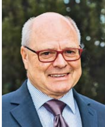
Bezirksvorsteher Lothar Basche