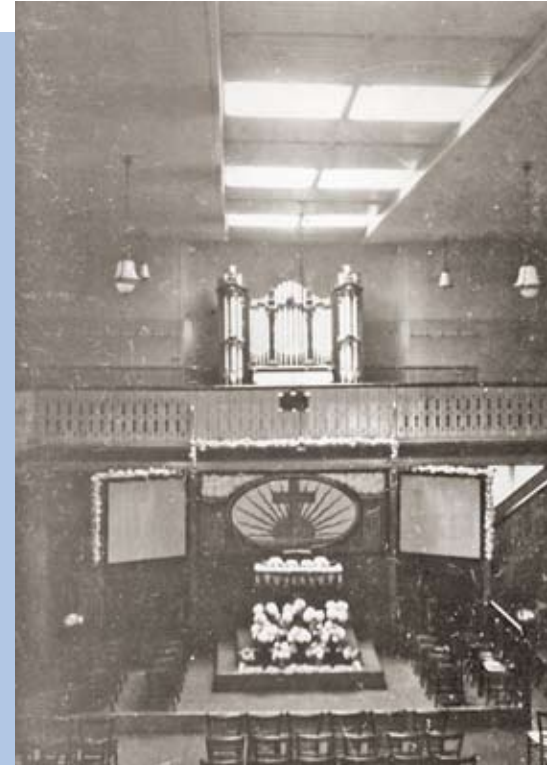
Kirchenschiff um 1925