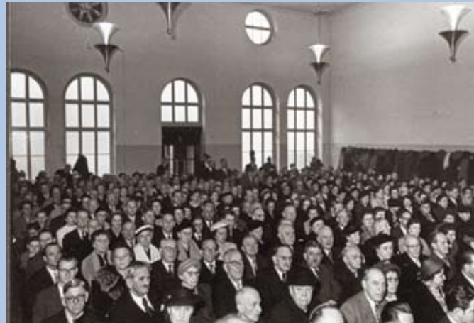
Kirchenschiff, genaue Zeit der Aufnahme unbekannt