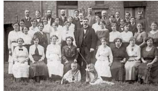
Chor der Gemeinde Frankfurt-Ost während des Ersten Weltkriegs im Hof der Petterweilstraße 10

1917 Im Zusammenhang mit der Versorgung von Soldaten im Ersten Weltkrieg mit dem Heiligen Abendmahl beginnt die Einführung der Hostie anstelle der Verwendung von Weinkelchen und ungesäuertem Brot.