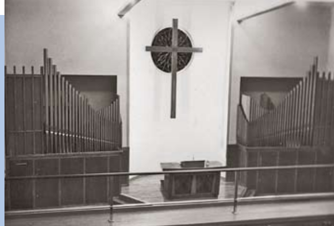
Kirchenschiff nach dem Umbau von 1959