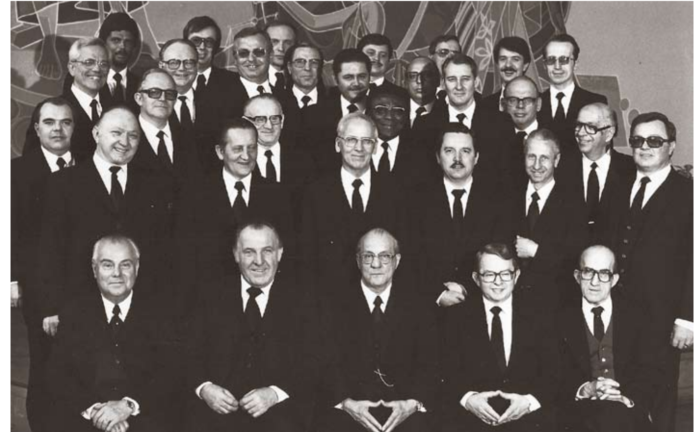
Amtsbrüder Frankfurt-Ost 1976: