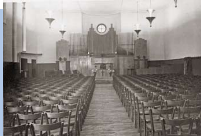
Kirchenschiff nach dem Zweiten Weltkrieg