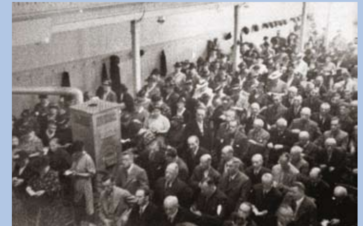
Kirchenschiff vor dem Zweiten Weltkrieg