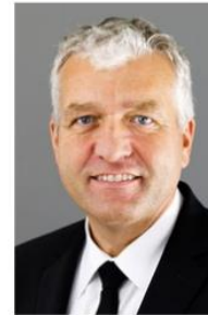
Apostel Franz-Wilhelm Otten