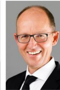
Bischof Ralf Flore