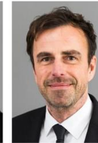
Bischof Rainer Sommer