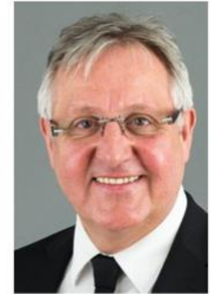
Bischof Roland Eckhardt