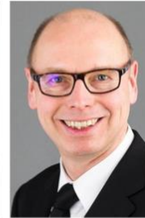
Bischof Manfred Bruns